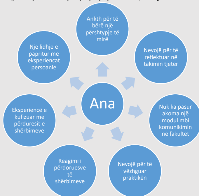
Figura 2. Shembull i diagramës merimangë mbi faktorët që kontribuojnë në ndërhyrje