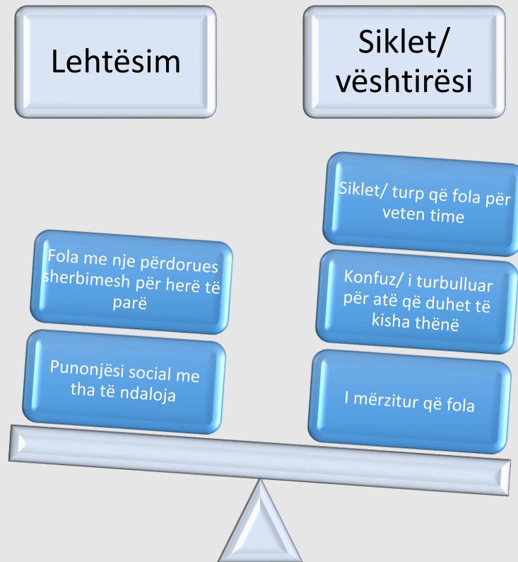
Figura. Balancimi i emocioneve/ ndjenjave komplekse

Ndjehem shumë konfuz tani. Ndjehem e ngazëllyer: Fola me një përdorues shërbimesh për herë të parë. Por ndjehem e humbur sepse ishte një katastrofë. Thjesht doja të zhdukesh dhe të zhytesha në kolltukun që isha ulur kur fillova të flas për veten time, nuk e ndaloja dot veten edhe pse e kuptoja që kjo ishte gabim.