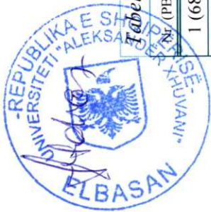
Tabela nr. 6 ( nr. B.2.20.)